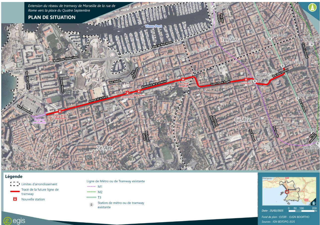
Figure 2: Plan du projet d'extension